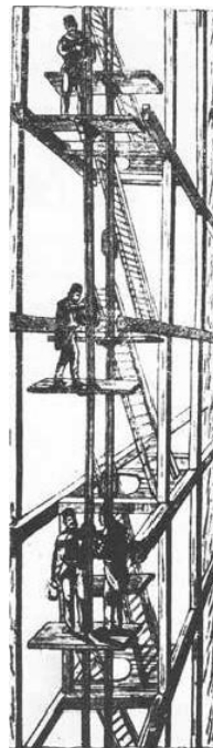
Lezný (stoupací) stroj

Po této prohrané stávce a následkem sociálního hnutí v Německu a Anglii donuceno i Rakousko-Uhersko dělnictvu Částečně ulevit.