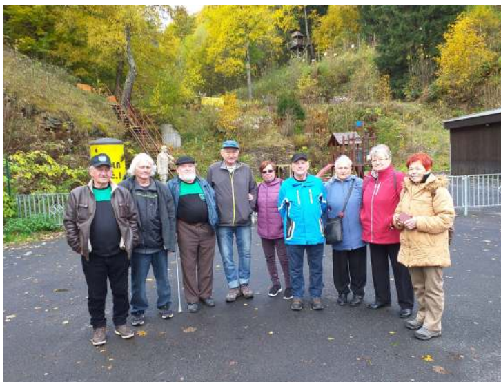
jemce o fárání upozorňují, že pro běžnou veřejnost není přístupné. Na internetových stránkách dolu Svornost je ale k vidění dostatečné množství fotografií.

V blízkosti Svornosti se nachází štola č. 1, ve které pracovali tzv. muklové, lidé nepohodlní minulému režimu (MUKL = muž určený k likvidaci). Do této štoly jsme nešli, protože by nás tam nečekalo nic jiného, než co jsme už viděli ve Svornosti. Případné zá-