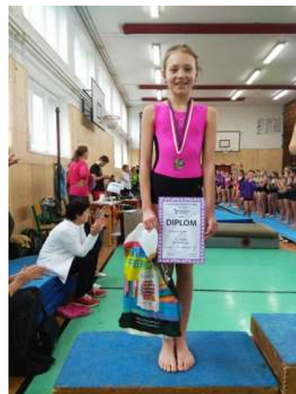
Připravil Pavel Liška

nasazení v trénincích sportovní gymnastiky, díky kterému se jí v minulém roce podařilo zvítězit jak v oblastní soutěži v Tlučné, tak i v krajském přeboru, ze kterého postoupila do republikového finále. Zde se jí ve velké konkurenci 60 závodnic podařilo obsadit 16. místo.