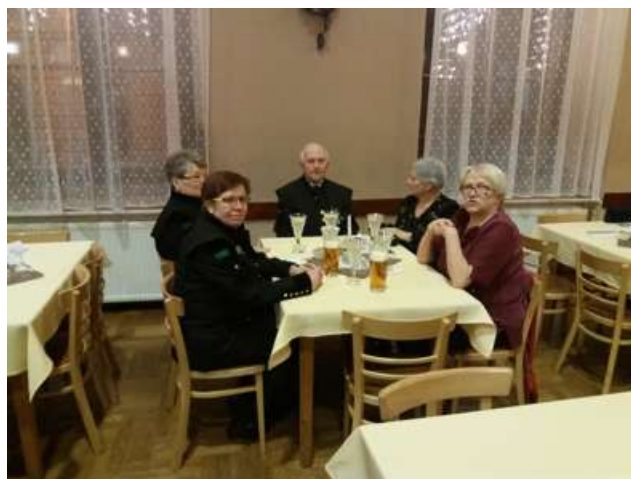
Tlučenská skupina na plesu v Příbrami a Chotěšově

Letošní rok jsme jako už tradičně zahájili hornickým bálem v Obecním domě v Chotěšově. Účast nebyla tak velká jako třeba loni, ale ta stovka přítomných, pro které spolek připravil bohatou tombolu, dobrou zábavu a občerstvení, se opravdu dobře bavila a jako vždy se už těší na naši další akci. Letos náš čeká významné výročí 100 let od tragické události na dole Austria v Týnci s uctěním památky 11 obětí této tragédie. To znamená radikální opravu po-