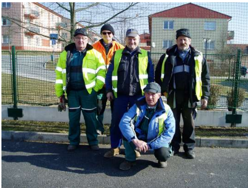
Část čety při instalaci sítí na hřišti